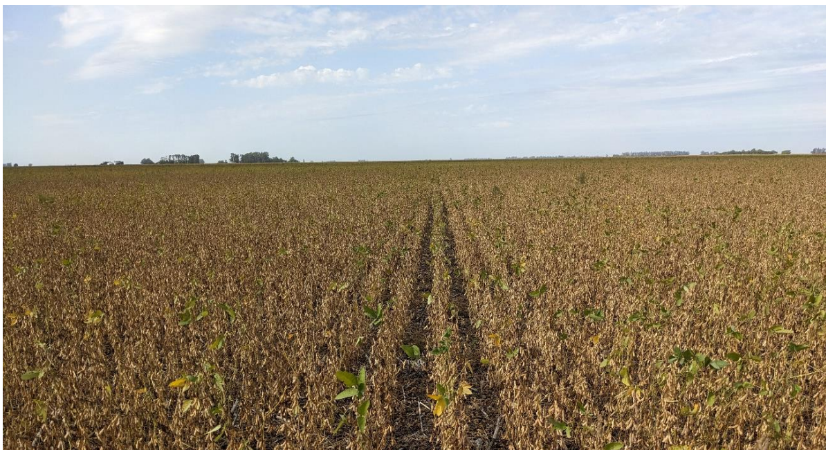
Soja de primera en madurez fisiológica. General Villegas, Buenos Aires (29-03-23).

Finalmente, sobre el norte del área agrícola, lluvias registradas durante las últimas semanas mejoraron el escenario del cultivo mientras un 73% del área sembrada se encuentra en etapas críticas para la definición de los rendimientos (R3-R6). Sin embargo, se prevén mermas en los rendimientos como consecuencia de las altas temperaturas.