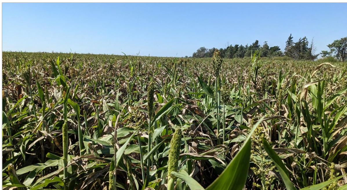
Lote de sorgo granífero iniciando el panojamiento. Mattaldi, Córdoba (28-03-23).

Sobre la región del Centro-Norte de Santa Fe, las últimas precipitaciones ralentizan el avance de las cosechadoras. Hacia la zona Centro-Este de Entre Ríos los rindes recolectados se encuentran por debajo de las productividades de las últimas campañas. En las zonas Cuenca del Salado y el Centro de Buenos Aires gran parte de los cuadros están culminando su ciclo.