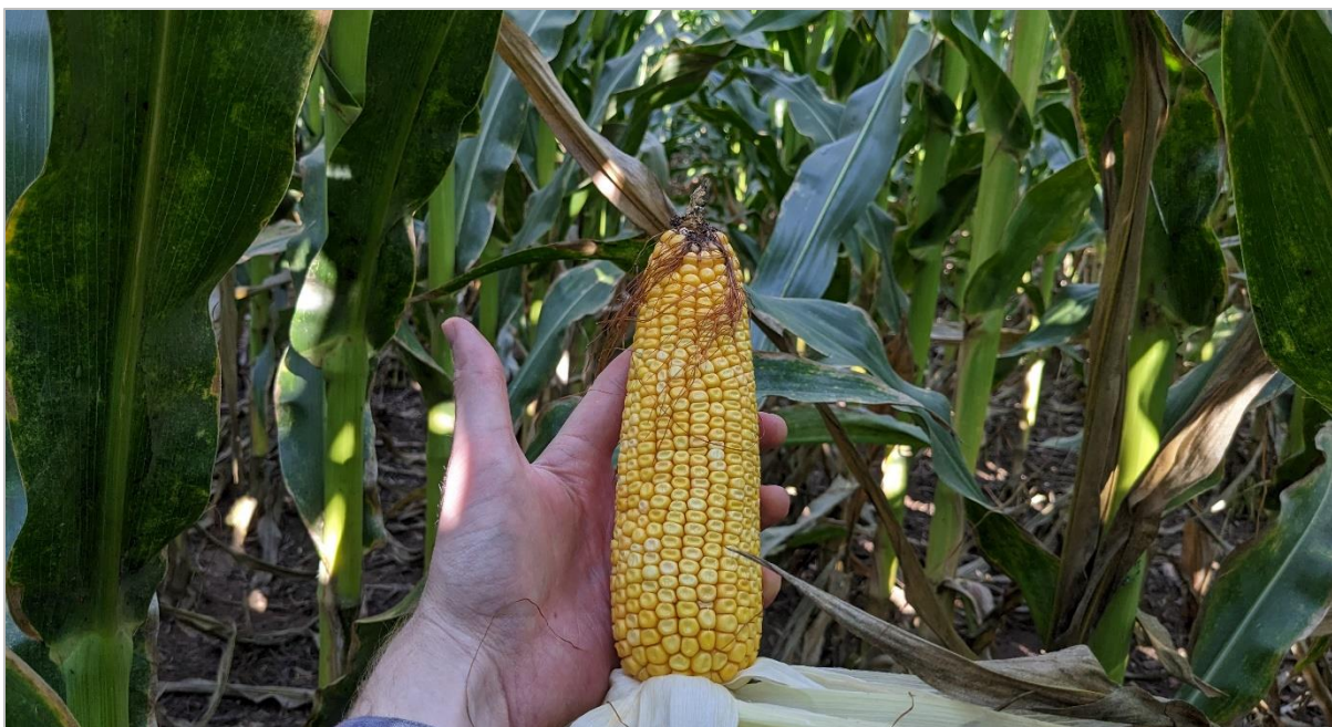
Lote de maíz tardío culminando el llenado de granos. Vicuña Mackenna, Córdoba (28-03-23).

Las lluvias de este mes mejoran el nivel de reservas hídrica, pero llegan tarde para tener un impacto fuerte en los rindes. En el Núcleo Sur la cosecha de lotes tempranos registra rindes por debajo de las expectativas iniciales. En las provincias de Córdoba y San Luis, gran parte de los lotes tardíos se encuentran en la última etapa de su ciclo.